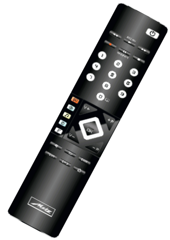
Black with brushed aluminium decorative trim and aluminium surround