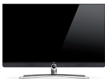
Table Stand Connect 40 – 48 B 91,0 / H 60,4 / TP 5,5 / TG 25,7 Chrom, manuell drehbar (+ / - 20°)